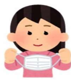
マスクのはずし方

マスクの表面にウイルスなどの飛散物が付着している可能性があります。耳にかけるゴムの部分を持ってはずします。