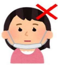
着用したマスクを顎にかける

ブリーツを上下にひらき、マスクを広げる。顔にあて、ノーズフィッター部分が鼻筋にフィットしたら、顔にフィットさせながら耳かけゴムを耳にかける。