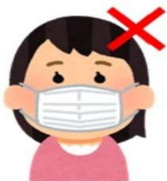
サイズが合っていない

自分の咳などが飛散しない効果はあるが、鼻からのウイルスの侵入を防げない可能性がある。